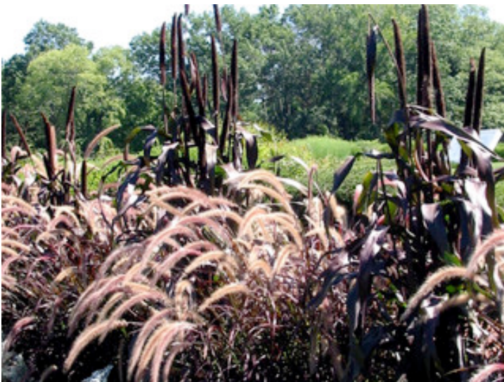
Pennisetums en massif

actuelles, expression d'une envie affirmée de naturel, de liberté, d'authenticité.