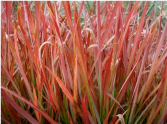
Imperata cylindrica Red Baron

Leymus arenarius ) toutes les nuances de vert, de tendre à foncé, sans oublier le pourpre ( Imperata cylindrica 'Rubra'). Certains sujets présentent même des nuances gris argenté ( Arundo donax ou canne de Provence, Koeleria , Sesleria ). Il existe aussi des formes panachées très ornementales ( Arundo donax 'Variegata', Hakonechloa macra 'Aureola', Miscanthus sinensis 'Zebrinus').