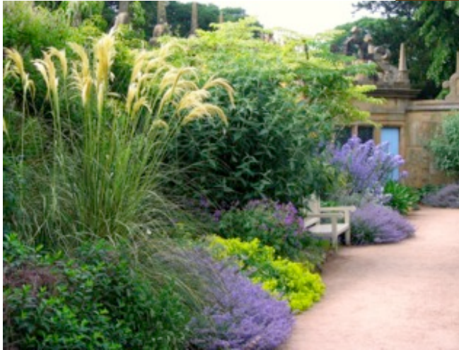
Miscanthus dans un massif