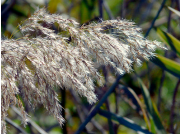
Arundo donax - Inflorescence

La majorité des graminées se plaisent au soleil, quelques-unes tolèrent la mi-ombre. Rares sont celles qui supportent l'ombre.