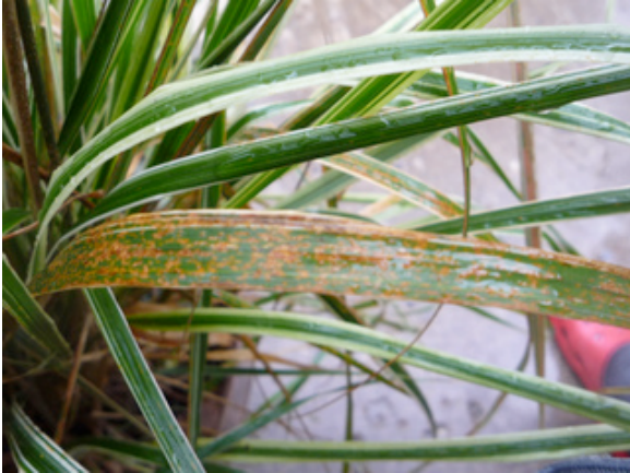
Rouille sur graminée

développent à l'intérieur des tiges. Celles de la noctuelle ponctuée ( Mythimna unipunctata ) dévorent les bords des feuilles. Mais il est rare que les dégâts soient importants.