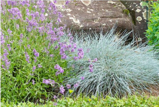
Festuca glauca 'Elijah Blue' - Fétuque bleue

Elles sont aussi une excellente réponse dans les terrains secs et pauvres. Leur frugalité, leur robustesse naturelle, le peu de soins qu'elles exigent, leur permettent de s'adapter à des conditions extrêmes, tout en nécessitant des entretiens minimes. Il est ainsi possible de couvrir et de valoriser des surfaces qu'il serait difficile d'exploiter autrement.