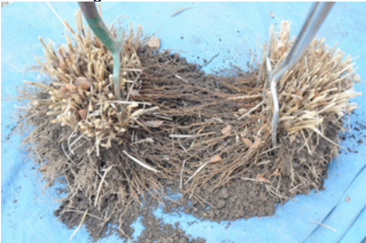
Division d'une touffe de graminée

Divisez les touffes de la plupart des espèces tous les 3 ou 4 ans, pour leur conserver toute leur vigueur.