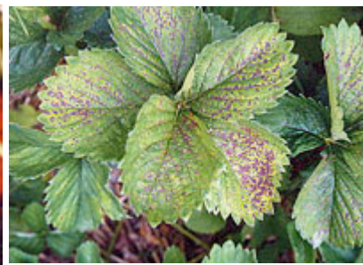
Taches pourpres sur feuilles