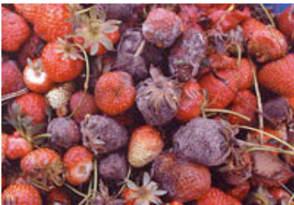
Botrytis sp. sur fruits